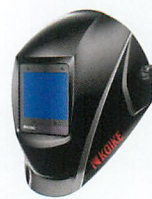
マグネタイトブラックメタリック (黒)