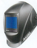
チタニウムグレーメタリック (シルバー)