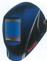
ピュアブルーメタリック (青)