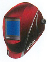
ソウルレッドメタリック (赤)